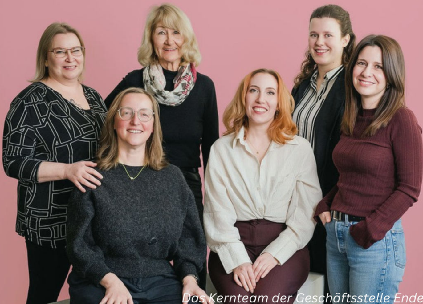
Das Kernteam der Geschäftsstelle Ende 2025